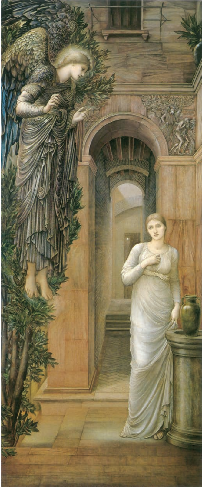
図版2 E.C. バーン = ジョーンズ 《受胎告知》1876-1879年 カンヴァスに油彩、250×104.5 cm 所蔵：Lever Art Gallery, Port Sunlight