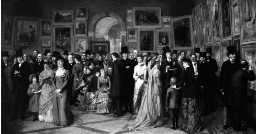
挿図1 W.P. フリス《ロイヤル・アカデミー展の招待日》1881年、カンヴァスに油彩、103×196 cm、個人蔵 画面右手の親子と向かい合って立つ長身の男性がワイルド、中央の椅子に座る婦人と話しをする男性は会長のレイトンである。