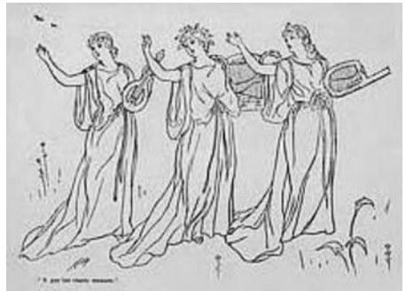
挿図4 『ペイシェンス』250回公演記念プログラム、J. E. ケリーによる挿絵 1881年12月29日発行

しかし一方で、本論前半でみたように、イギリス19世紀の後半は、展示という場に変化が生じた時代である。かつての宮殿のように、空間のなかで、美を享受するという意識が、グロヴナーのようなギャラリーで具体化された。それにより上述のような審美主義的機運を強めたともいえるのであるが、バーン =