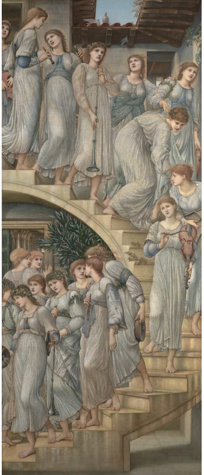
図版1 E.C. バーン＝ジョーンズ 《黄金の階段》 1876-1880年、カンヴァスに油彩 269.2×116.8 cm