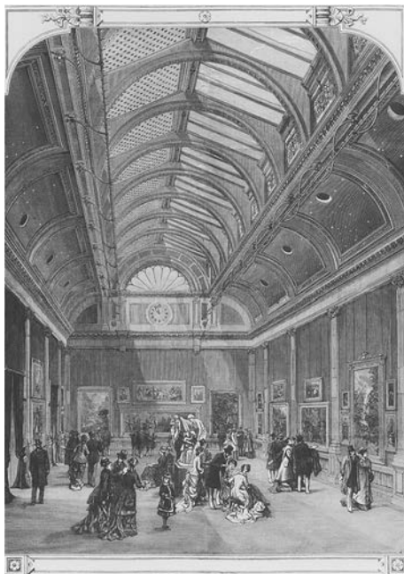
挿図2 グロヴナー・ギャラリー （西ギャラリー）

二人が知り合ったのは、芸術家がよく出入りしていたロンドンのホランド・パークにある「リトル・ホランド・ハウス」 13 であり、バーン＝ジョーンズも無名