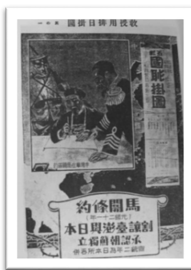
図2 国恥掛圖 10)